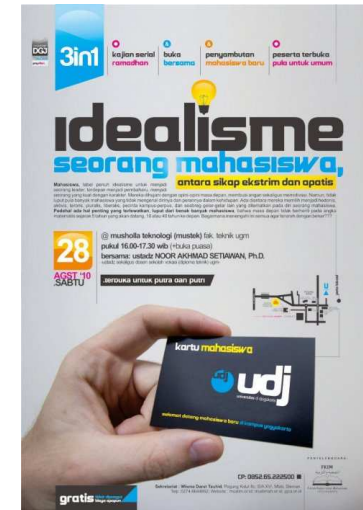
Gb.3. Pamflet kajian penyambutan mahasiswa baru