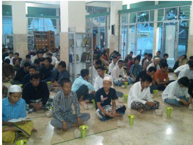
Gb.1. Buka bersama di Masjid Pogung Raya