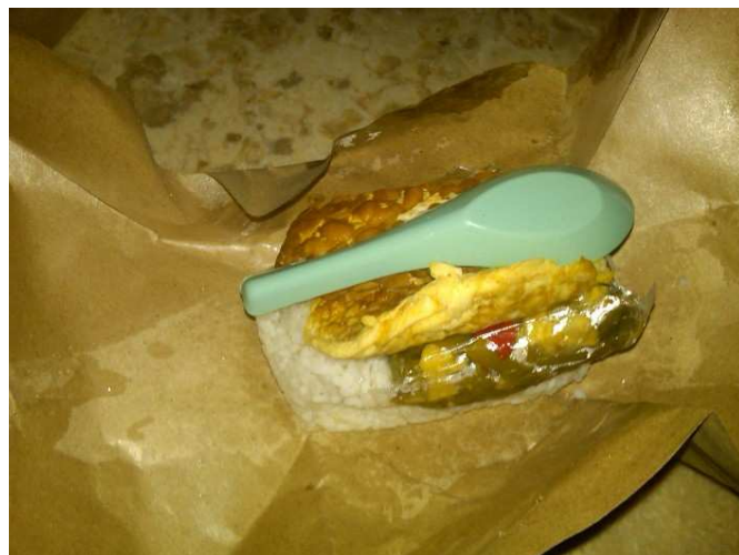
Gb.2. Contoh menu buka di Masjid Pogung Raya